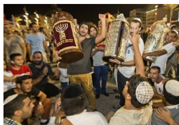
Vreugde der wet